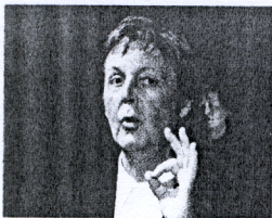
MEHR TANTIEMEN. Paul McCartney darf verdienen.

Die EU-Kommission meint es gut mit betagten Musikern und will das Schutzrecht der Urheber von bisher 50 auf 95 Jahre ausdehnen. Damit können Künstler auch im Alter über diese Einkommensquelle verfügen. Vor allem in Großbritannien wären in den nächsten Jahren 7.000 Musiker wie etwa die Beatles oder Cliff Richard von diesem Einkommensausfall betroffen gewesen.