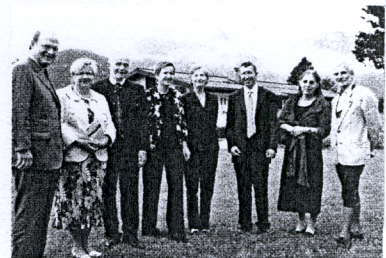
Eröffnung der Sommeruni bei schlechtem Wetter und guter Laune.